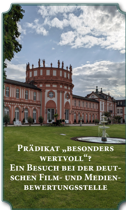
PRÄDIKAT „BESONDERS WERTVOLL“? EIN BESUCH BEI DER DEUTSCHEN FILM- UND MEDIENBEWERTUNGSSTELLE

Die Infoveranstaltung des Freiwilligenzentrums gibt Ihnen einen Überblick über vielfältige Einsatzmöglichkeiten und den Rahmen.