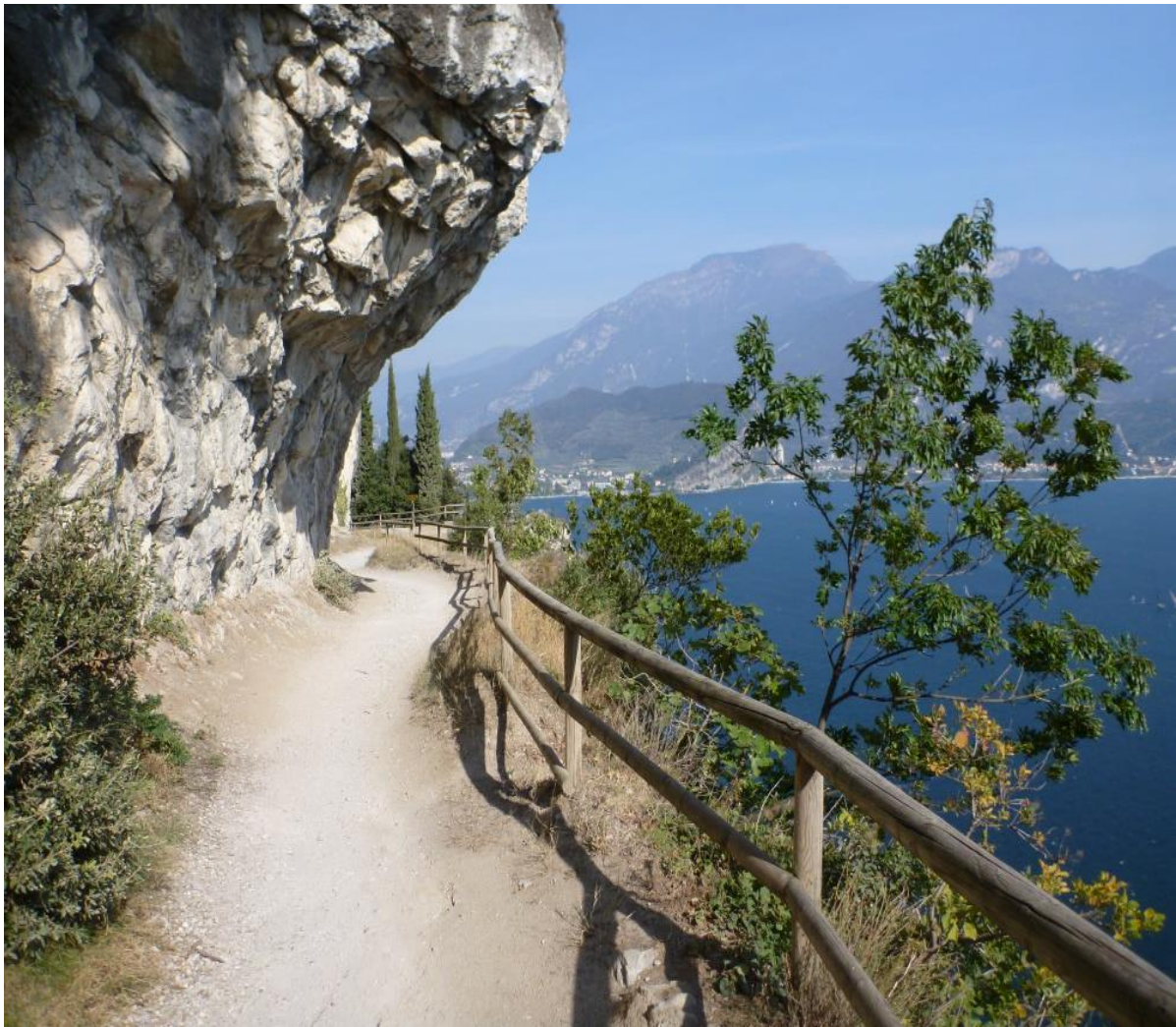
Der Panoramaweg mit pittoresken Motiven ist nahe gelegen und von Tignale leicht zu erreichen

Für interessante Gemäldeumsetzungen können neben der Skizze auch Fotos genutzt werden. Weitere Bildmotive sind vorhanden, können aber auch gern mitgebracht werden. Die Naturerlebnisse und Ausflüge erschließen eine malerische Vielfalt an Motiven, die in der Skizze und/oder Aquarell festgehalten werden, und die später, im Atelier oder im vhs-Kurs einen reichen Schatz an Inspirationsquellen darstellen.